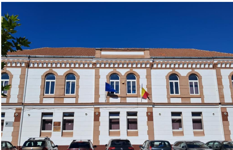
Corp A Str. Pieții nr. 1