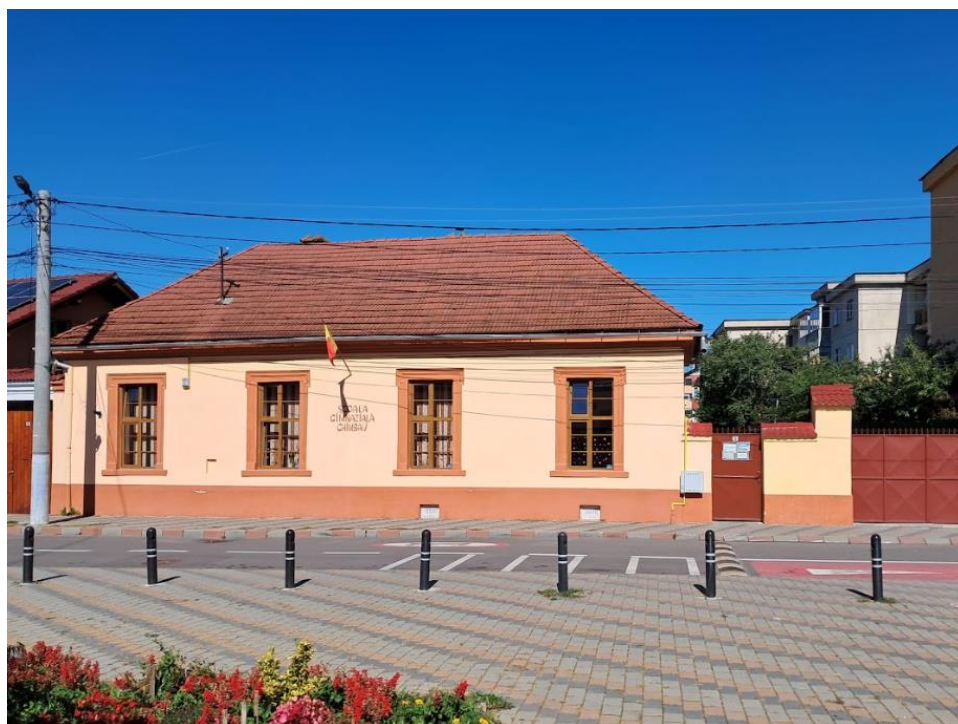
Corp C Str. Școlii nr. 6