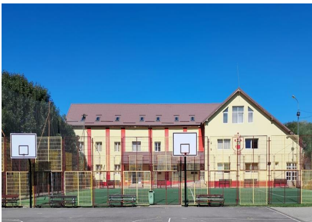
Corp B Str. Pieții nr. 1