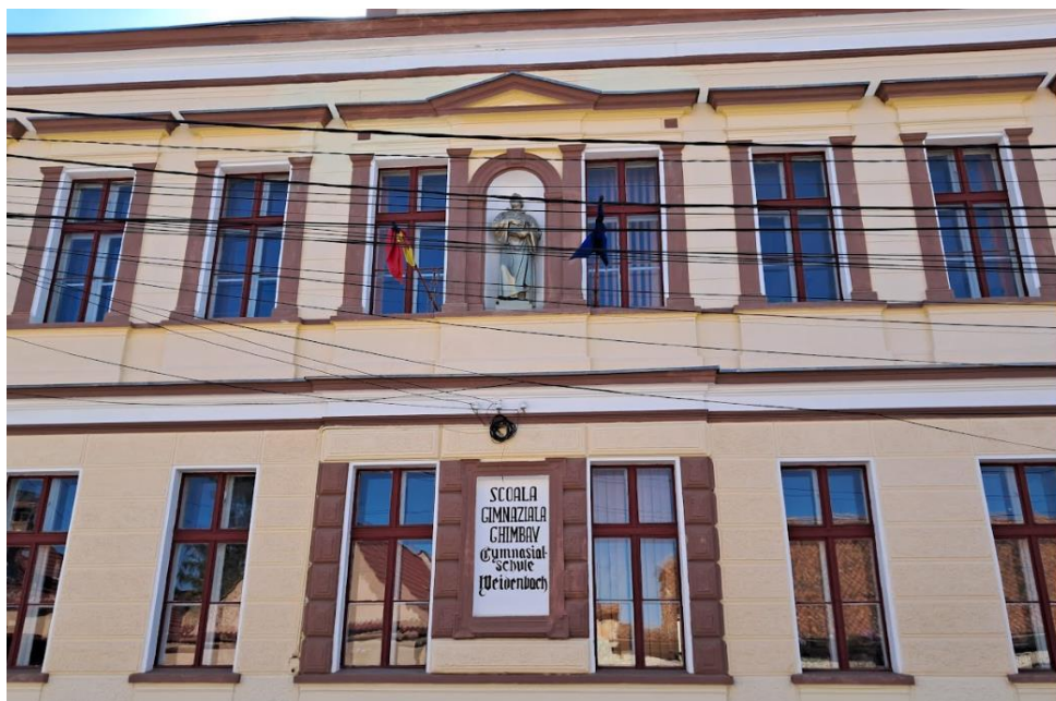
Corp C Str. Școlii nr. 7